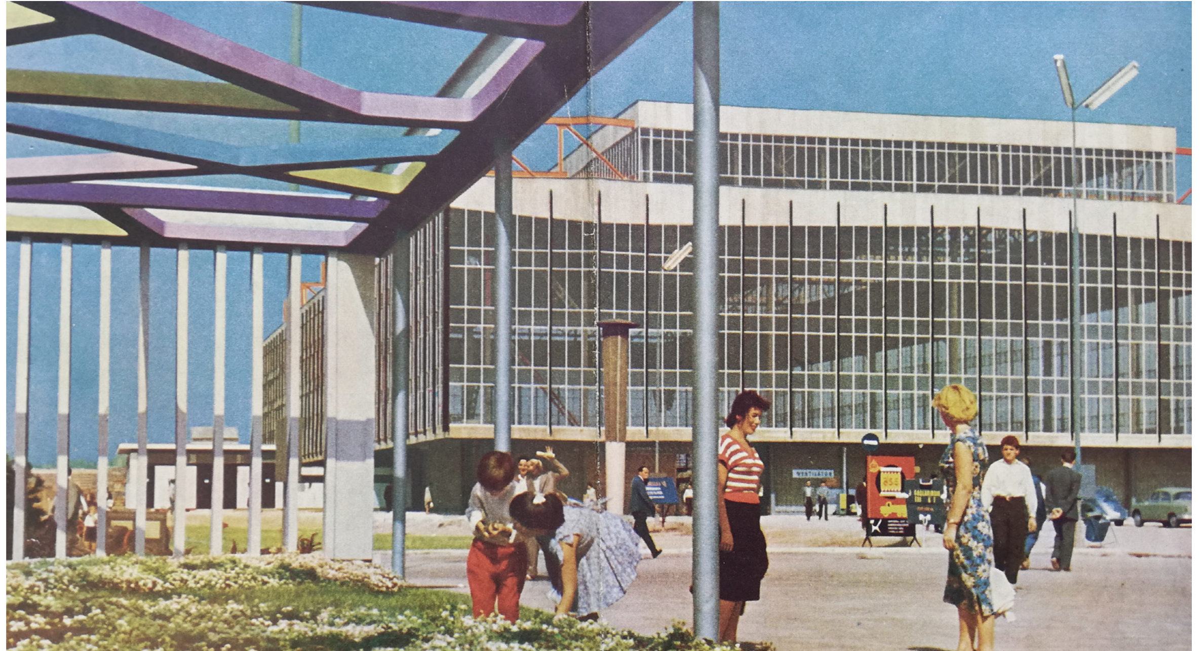
HR-DAZG-1172. Katalozi. JZV 1959.,9 _ Catalogues IAZF, 1959