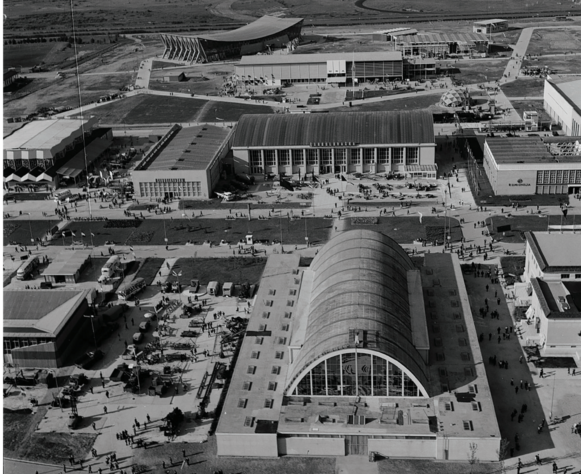
Pogled na Aleju nacija, 1956. _ Avenue of Nations view, 1956

Odluka da se 1955. godine krene u izgradnju novog sajamskog prostora na desnoj obali Save rezultirala je gradnjom jednog od najvećih sajmišta u poslijeratnoj Europi te omogućila stvaranje infrastrukturnih preduvjeta potrebnih za razvoj Novog Zagreba. U periodu od 1956. do 1990. podignuto je preko 50 što paviljonskih što pomoćnih zgrada koje su iz godine u godinu ugošćavale trgovce, tvrtke i posjetitelje iz cijeloga svijeta. Tijekom pedesetih Zagreb je jedno od rijetkih mjesta na kojemu neposredno trguju zemlje Istočnog i Zapadnog bloka, da bi šezdesetih Velesajam bio trgovinsko i diplomatsko ogledalo politike nesvrstanosti s najvećim brojem zemalja trećeg puta koje izlažu svoje proizvode. Paralelno, posjetitelji osim općih izložbi uzoraka, pohode izložbe suvremenog odijevanja, dizajna i načina oblikovanja životnog prostora, izložbe knjiga i tehnike, edukativne formate povezane s emancipacijom žena, razvojem turističkih navika i kulturne događaje. Izvan sajamskih termina neki od paviljona služe kao setovi za impozantne filmske setove, drugi za kulturne i sportske priredbe.