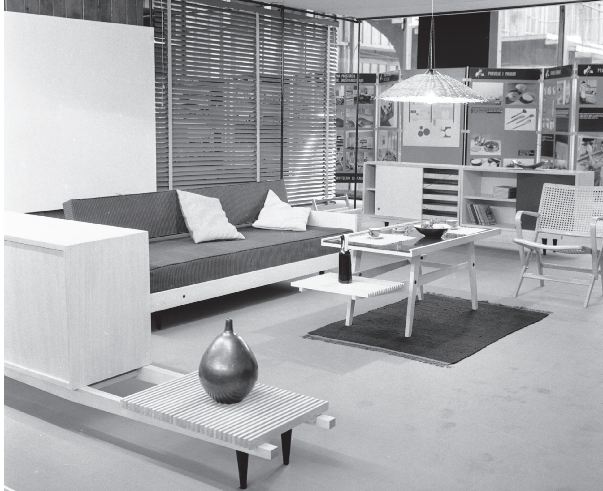
Porodica i domaćinstvo, 1957. _ Family and Household, 1957

The decision to begin construction of a new fair ground on the right bank of the Sava River in 1955 resulted in the creation of one of the largest exhibition centers in post-war Europe, facilitating infrastructural prerequisites necessary for the development of New Zagreb. From 1956 to 1990, more than 50 pavilions and auxiliary buildings were erected, which were hosting traders, companies and visitors from around the globe every year. During the 1950s, Zagreb was one of the few places where countries of the Eastern and Western Blocs traded directly, and by the 1960s, Zagreb Fair had become a commercial and diplomatic mirror of non-alignment policy, showcasing products from the largest number of Third World countries. Concurrently, visitors not only attended general sample exhibitions but also visited exhibitions of contemporary clothing, design and ways of shaping living spaces, as well as book and technology exhibitions, educational formats related to women's emancipation, the development of tourist habits and cultural events. In the off-fair period, some pavilions served as sets for impressive film productions, while others hosted cultural and sports events.